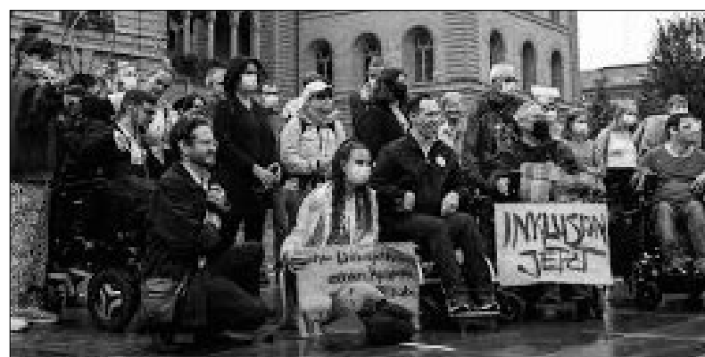
Für Gleichstellung kämpfen oder wütend sein: Sammeln Sie Unterschriften für die Inklusions-Initiative.

Sammelkarten und Unterschriftsbögen können Sie auf https://www.procap.ch/inklusions-initiative/ herunterladen oder auf unserer Geschäftsstelle anfordern. bs.